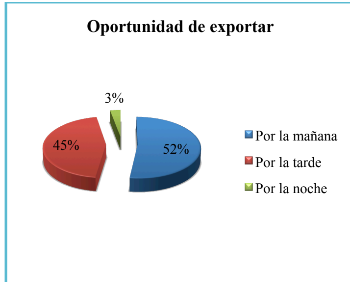
Figura # 2 Oportunidad de exportar.

Nota. Fuente: Encuestas a floricultores otavaleños.