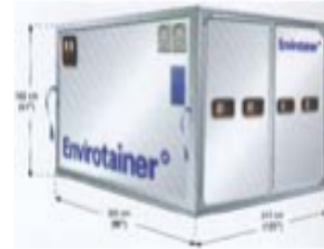
Figura # 1 Tipo de contenedor aéreo a utilizar.