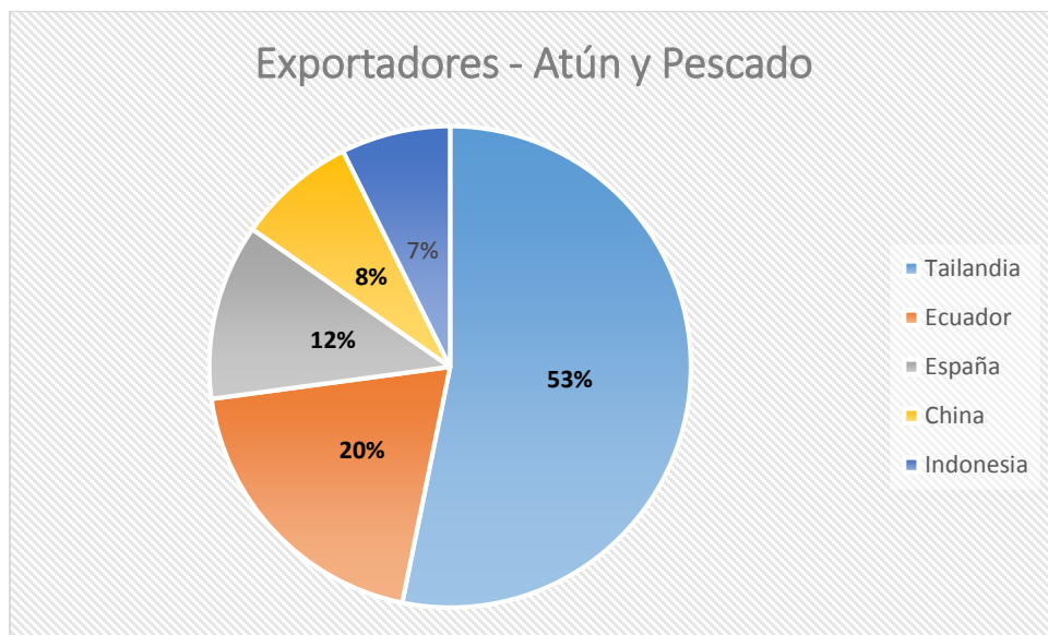
Gráfico#1: Principales exportadores de atún

la Dirección de Inteligencia Comercial e Inversiones, PRO ECUADOR (2013), en la industria pesquera, Ecuador exporta en primer lugar el atún en modalidad de conserva, atún congelado de aleta amarilla seguidos en un menor nivel los filetes de atún congelados y atunes ojo grande, por lo que nos basaremos en el tipo de atún en conserva para analizar sus competidores.